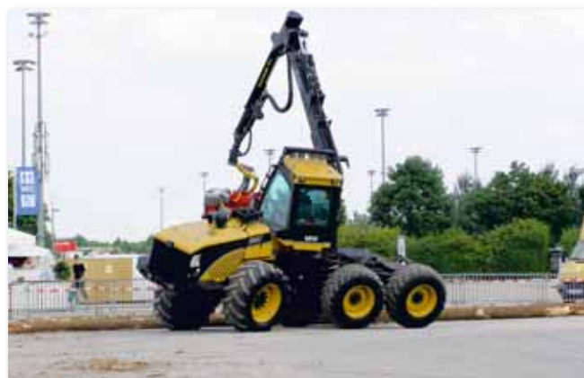
Verbesserte Sozialstandards über Forstunternehmerzertifikate ohne Schiefelage für die einzelnen Firmen.

Die tarifgerechte Entlohnung fordern ist eine Sache, deren Umsetzung gewährleisten und ggf. auch kontrollieren zu können eine ganz andere. Und schon zeigt sich wieder – der Teufel steckt im Detail. Sollen sich Forstbedienstete bzw. FSC-Auditoren künftig als „Tarifpolizei“ betätigen? Dies setzt zunächst einmal eine entsprechende Anpassung der Werkverträge und damit zusätzlich Bürokratie voraus. Und dann kommt die Kontrolle selbst, die Zeit und Nerven kosten wird.