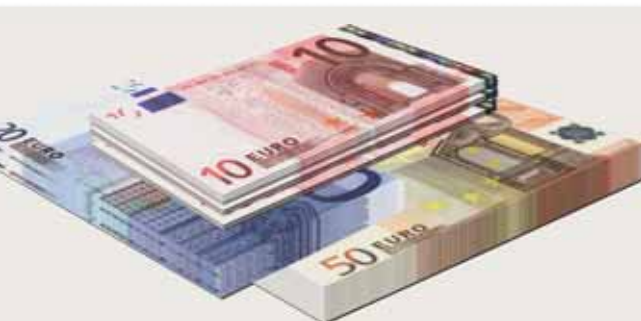
Die Spendenaktion erbrachte insgesamt über 111.000 €.