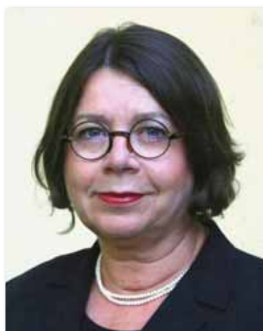
Cornelia Behm, MdB (BÜNDNIS 90/DIE GRÜNEN)

den. Damit die Biomasse auch in bestehenden Anlagen effizienter genutzt