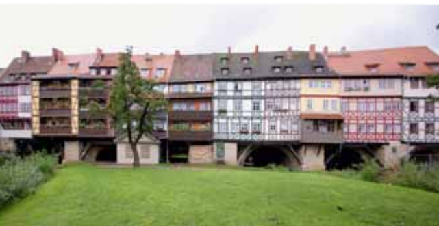
Die Krämerbrücke – eines der Wahrzeichen der Thüringer Landeshauptstadt.

Der diesjährigen Jahrestagung des DFWR in Thüringens Landeshauptstadt Erfurt wünschen wir einen guten Verlauf und neue Impulse für die Forstwirtschaft! ■