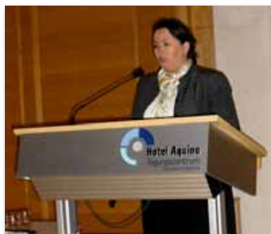
Ursula Heinen, parlamentarische Staatssekretärin im BMU.

Ursula Heinen, parlamentarische Staatssekretärin im Bundesministerium für Umwelt, Naturschutz und Reaktorsicherheit, stellte in ihrem Redebeitrag