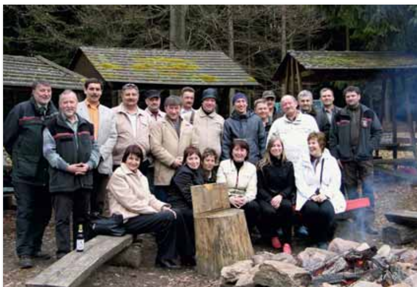
Russische Forstkollegen während ihrer Bildungsreise in Sachsen-Anhalt beim Exkursionspunkt im Forstbetrieb Ostharz.

Neben dem Landesforstbetrieb am Beispiel des Forstbetriebes Ostharz und dem Landeszentrum Wald anhand des Betreuungsforstamtes Harz wurden auch der private Waldeigentümer von Arnim und das forstliche Dienstleis-