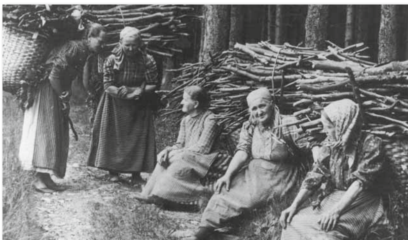
Schwerarbeit der Frauen 1923: Auf hoch bepackten Kiepen werden die Brennholzbindel nach Hause geschleppt. Eine kurze Verschnaufpause ist nötig.