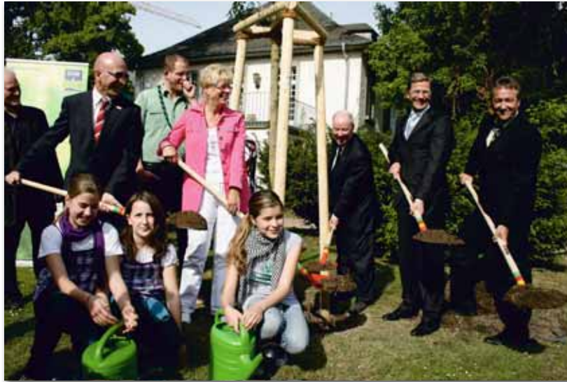
Mit der Pflanzung einer Blasenesche beendete Außenminister Dr. Guido Westerwelle die Aktionen zum diesjährigen Tag des Baumes. Im Internationalen Jahr der Wälder pflanzten SDW-Gruppen und Partner insgesamt mehr als 150.000 Bäume. Außerdem fanden zu diesem Baumehrentag zahlreiche Aktionen wie Waldfeste, Walderlebnistage oder Exkursionen statt.