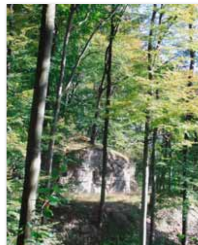
Kreuzkrug im geplanten Nationalpark Teutoburger Wald/Egge.