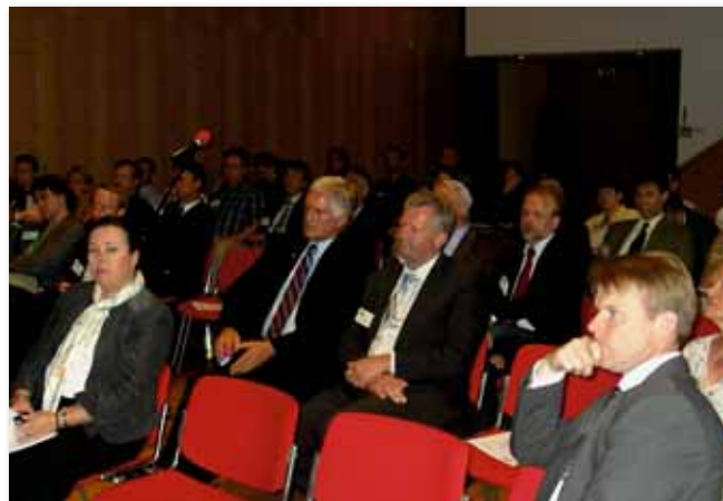
Das interessierte Publikum.

die Bedeutung der bundeseigenen Wald- und Naturflächen für den deutschen und europäischen Naturschutz dar. Dabei ging sie vor allem auf die besondere Verantwortung für die biologische Vielfalt ein. Diesbezüglich ist der Verkauf von Wald- und Naturflächen des Bundes nach ihrer Auffassung kontraproduktiv. Das Regierungsvorhaben zum Nationalen Naturerbe wertete Frau Heinen als großen Erfolg und lobte den umfassenden Naturschutzsachverständigen bei der Sparte Bundesforst. Für die weiteren Konversionsflächen formulierte sie den Auftrag an die Haushälter, den Privatisierungsdruck für diese Flächen zu senken!