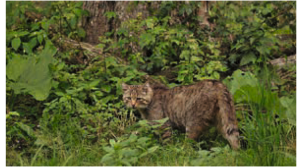
Wildkatze im Wisentgehege Springe

Rückfragen bei Fabio Krüger unter 0152 3376 3723 ■