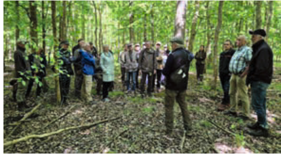
Die Senioren in einem geschlossenem Bu/Ei-Edellaubholzbestand.

gewann an Attraktivität für Wanderer und Naturbeobachter. Leider blieben die hoffnungsvollen Waldbestände wegen ihrer exponierten Lage unmittelbar hinter dem Nordseedeich von den in Schleswig-Holstein regelmäßig auftretenden Stürmen nicht verschont. Im Herbst und Winter 2013 fegten die Orkantiefs Xaver und Christian mit Windgeschwindigkeiten von bis zu 180 km/h über die deutsche Nordseeküste hinweg. Von den Naturgewalten wurden im Katinger Watt vor allem die zu beachtlichen Dimensionen herangewachsenen Pappelbestände stark in Mitleidenschaft gezogen. Glück im Unglück: Unter den Pappeln war bereits flächendeckend Naturverjüngung von Ahorn, Esche, Buche, Hainbuche, Eiche und Weichlaubhölzern gewachsen. Ein Teil der vom Sturm geworfenen Bäume blieb als Totholz liegen. Darüber wächst heute ein neuer, zum Teil sehr dichter Mischwald heran. Teile dieser Naturgeschenke sollen als Naturwälder ohne forstliche Bewirtschaftung bleiben. Fast unbeschadet haben die inzwischen 40 Jahre alten Eichen-Mischbestände die Stürme überstanden. Erste Durchforstungen zur Vergrößerung der Standräume für die verbleibenden Bäume sind erfolgt. Es wächst ein vielversprechender Wald heran, der in naher Zukunft neben dem bisherigen Brennholz auch wertvolles Nutzholz liefern wird. In den Edellaubholzbeständen mit Eschenanteilen fällt auf, dass leider auch im rauen Nordseeklima ein das Eschensterben verursachender Pilz gedeiht und zu einem Absterben vieler Eschen führt.