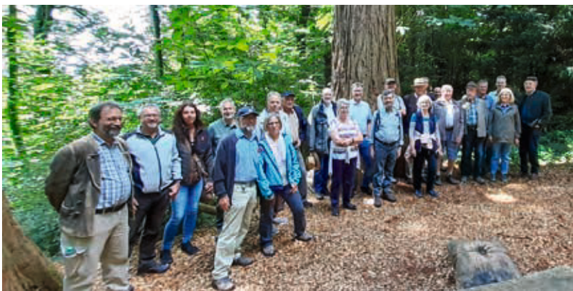
Die schwäbischen Senioren vor dem Mammutbaum des Forstlichen Versuchsgartens Grafrath

Am 22. Juli 2025 trafen sich 22 Senioren mit Partnerinnen aus dem Bezirk Schwaben im Walderlebniszentrum Grafrath, das als 12. WEZ in Bayern im März 2023 eröffnet wurde.