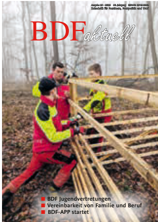
Die Auszubildenden von SaarForst im Saarland bei der Arbeit.